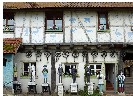
Ausstellung André Bindler..art brut...