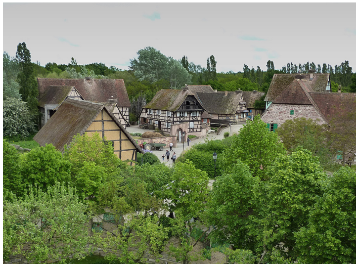
Musée & überall Storchennester

Am Nachmittag begleitet uns das Klappern der Störche auf den individuellen Streifzügen durch das weitläufige Gelände. ( Ballenberg à la Elsass ). Das gemeinsame feine Nachtessen rundet den ersten Exkursionstag ab – alle sind zufrieden und erfüllt von so viel Natur.