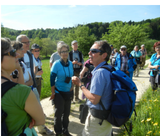
Lauschen, Suchen, Sehen, Riechen

Neuntöter-Pärchen – sehr hübsch! Nachtigallen soweit das Ohr reicht!