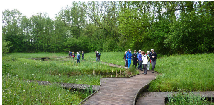
Petite Camargue Alsacienne