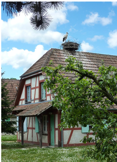
Logis mit eigenem Storchennest