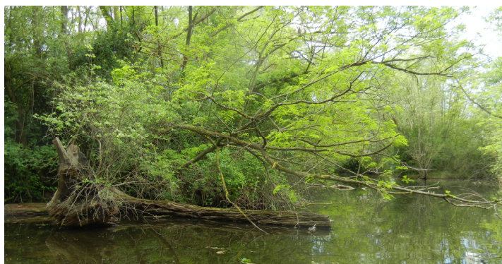
Liz Stallkamp Bonstetten, 20. Mai 2015

Unseren herzlichen Dank an die Exkursionsleiter für die tolle Organisation, die abwechslungsreiche Routenwahl und die ausgesuchten Hotspots im Sundgau, ein unbekannter und wunderbarer Landstrich ennet der Grenze – ein wahrer Geheimtipp!